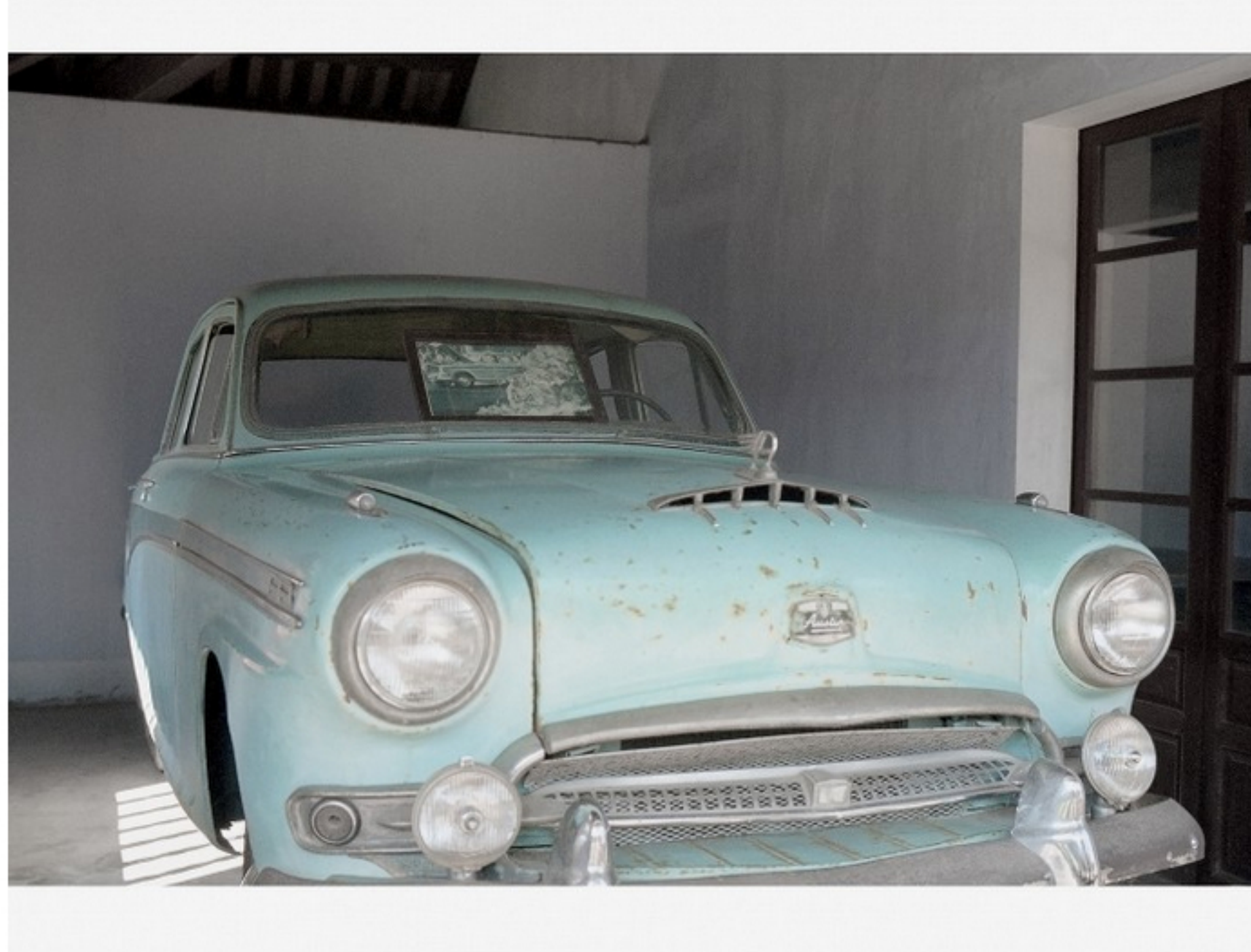
Hier zien we de Austin waarmee monnik Thích Quảng Đức op 11 juni 1963 naar Saigon reed om zichzelf daar, uit protest tegen discriminatie van boeddhistische monniken, in brand te zetten.