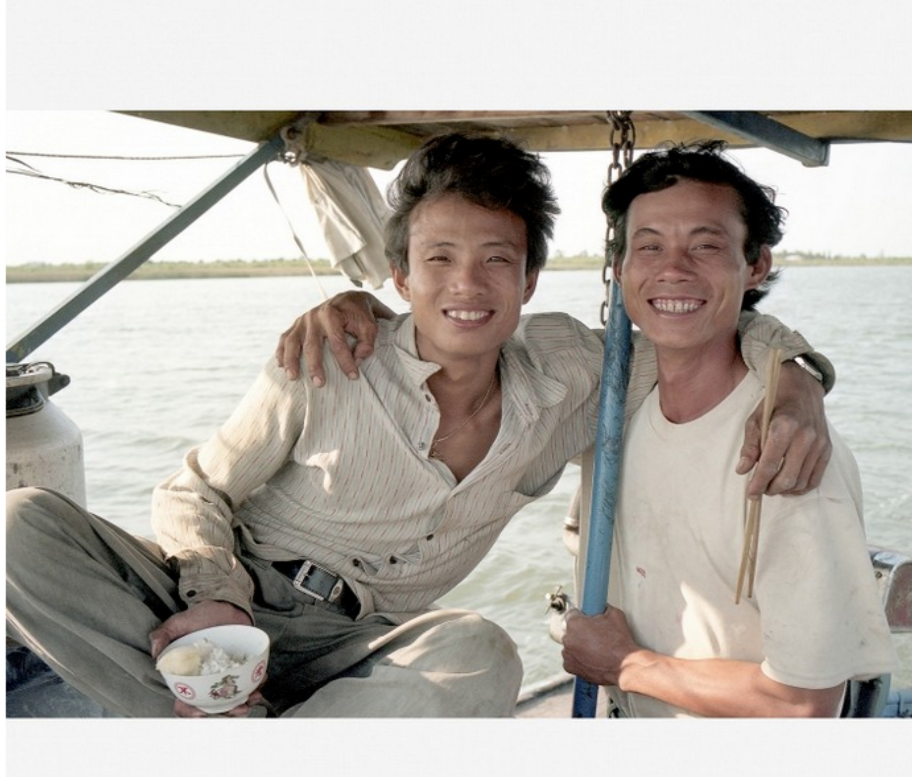
18 januari 1998, een boottocht van Cha Doc naar Ha Tien, Vietnam, op de foto zien we de schipper en de 'met-een-bambestok-de-boot-van-de-kant-af-duiver'. 'De tocht over de Mekong begon in het aarddonker, los van de maan, de sterren, de vierolstaafjes en de Mariabeelden met flitsende aureolen-lampjes. Langzaam trok de mist weg, verjaagd door de opkomende zon. Het was zo mooi: dit is wat ik wilde.'