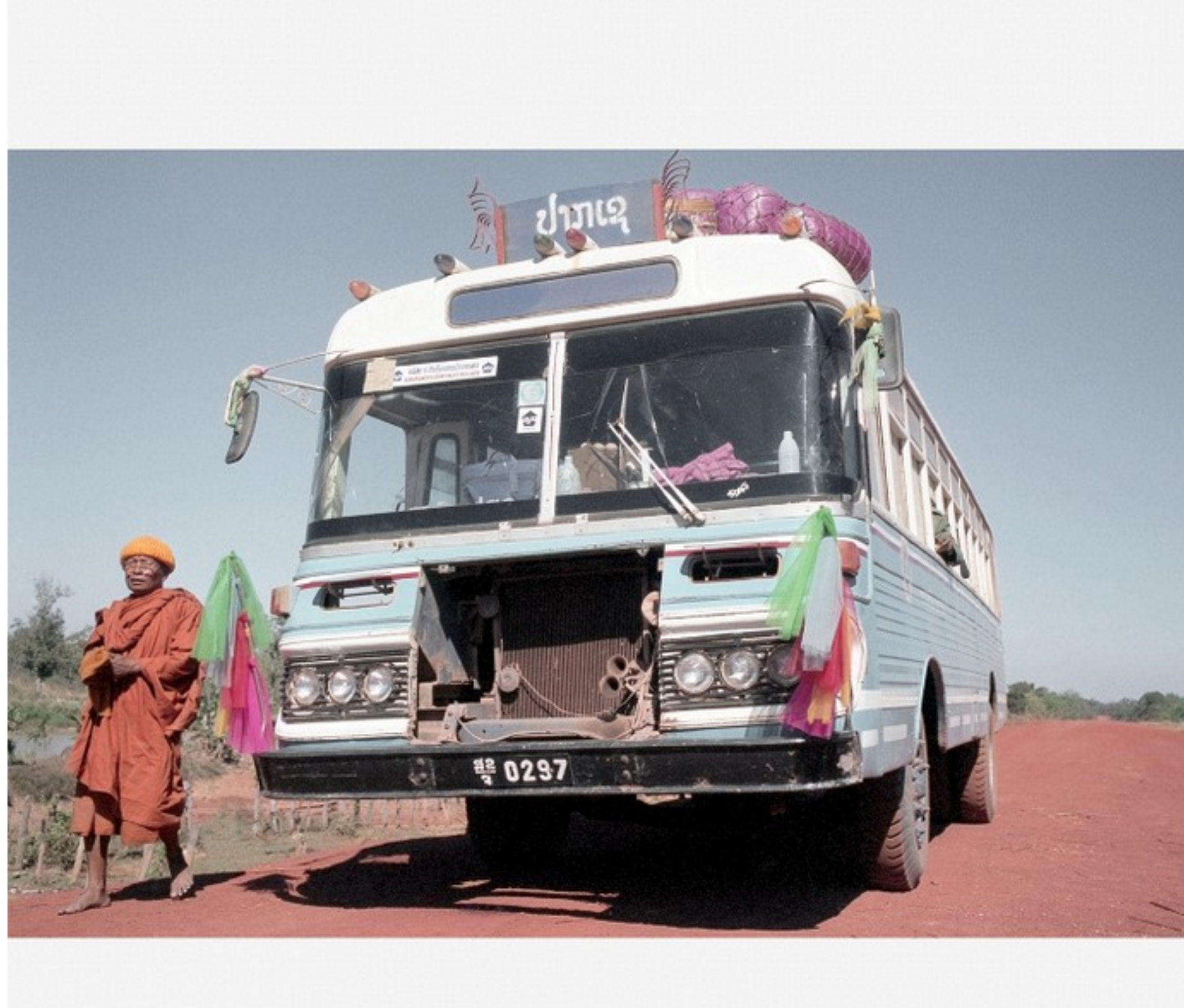
29 januari 1998, een busreis van Savannakhet (Laos) naar Pakse (Laos), een tocht van 200 kilometer die garant stond voor acht extreem stoffige uren.